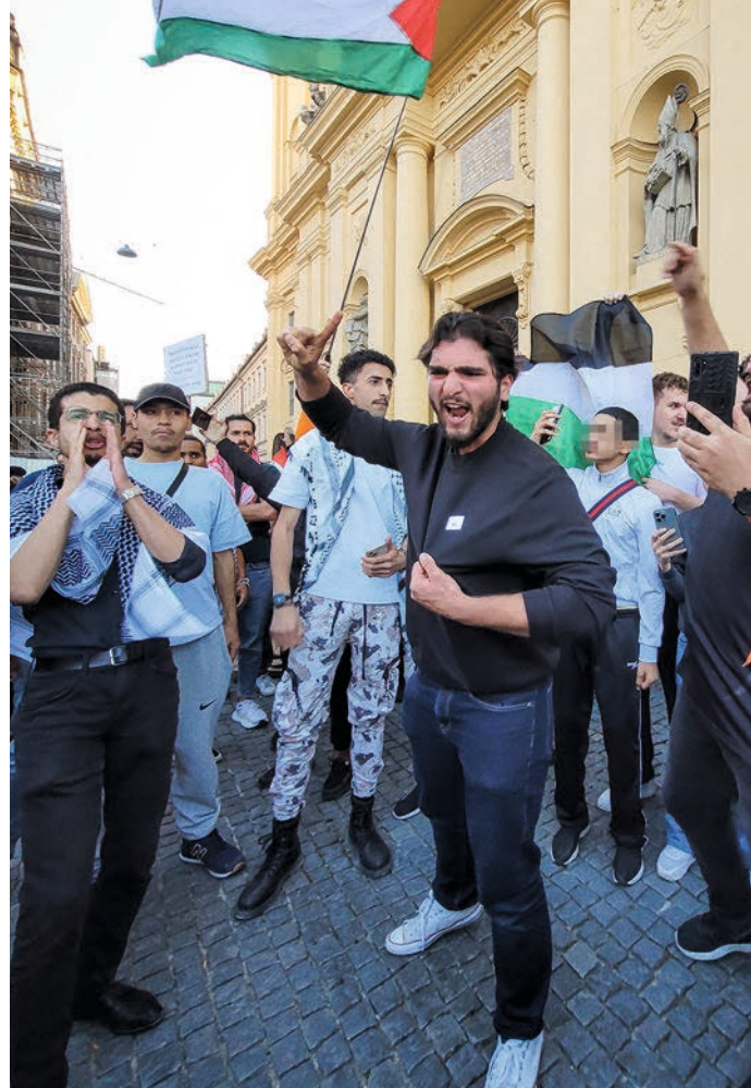
Pro-palästinensische Demonstranten rufen „Allahu Akbar“ und zeigen den sogenannten „Tauhid-Finger“ auf einer Demonstration am Odeonsplatz.