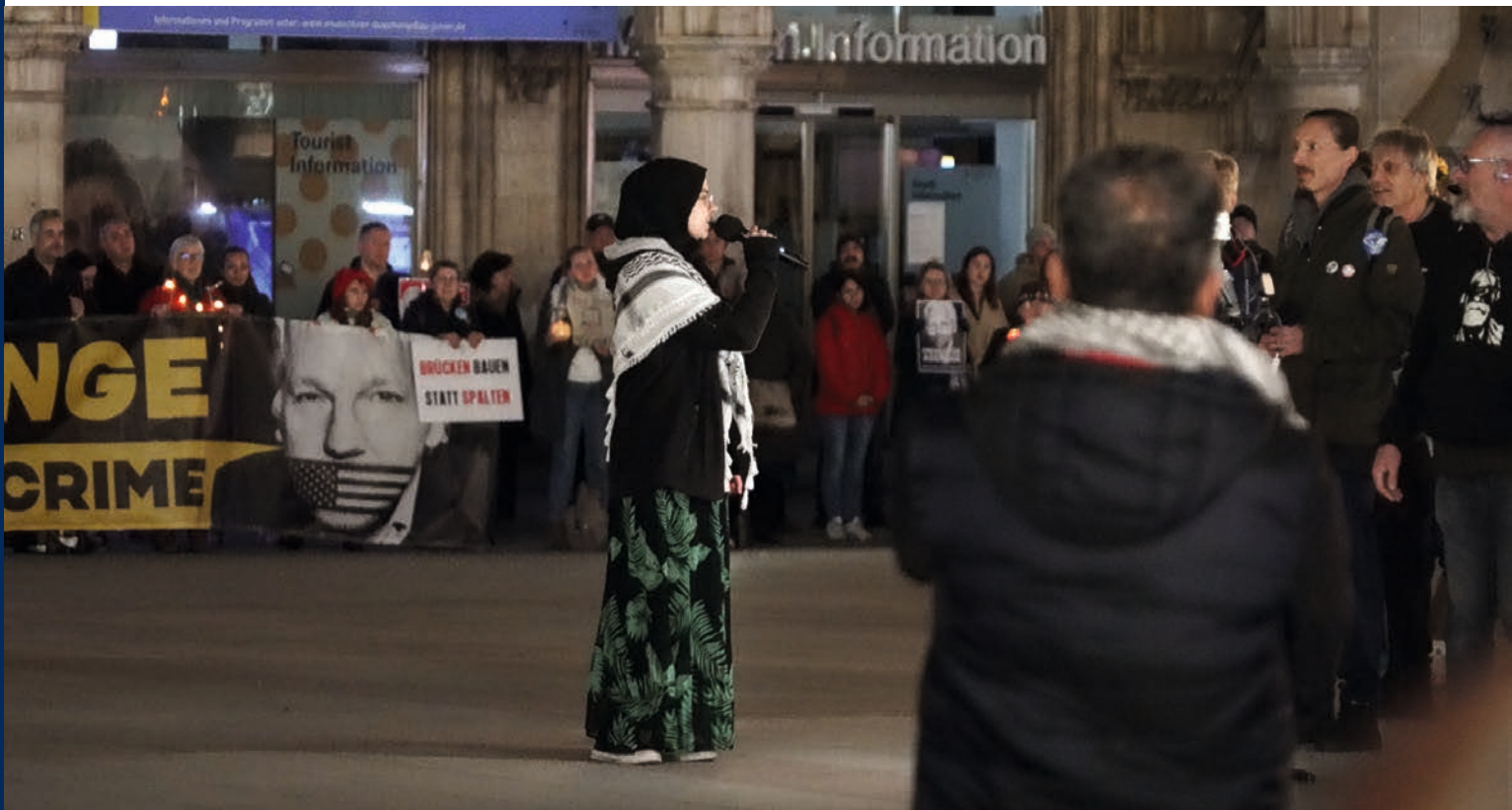
Eine führende Aktivistin von „Palästina Spricht München“ hält eine Rede auf einer gemeinsamen Kundgebung mit Pandemielegner*innen von „München steht auf“.

All dies zeigt nicht nur, dass Pandemielegner*innen und „Palästina Spricht München“ ähnliche Narrative benutzen, sondern auch, dass keine Berührungspunkte untereinander bestehen.