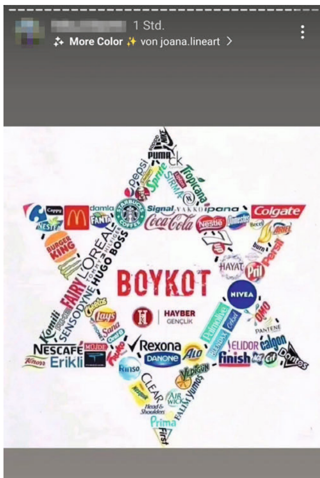
Ein „Palästina Spricht München“-Mitglied veröffentlichte online ein Bild, das Parallelen zum nationalsozialistischen Judenboykott aufweist.

Ein Instagram-Posting eines Mitglieds der Organisationsstruktur von „Palästina Spricht München“ aus dem Januar 2024 versinnbildlicht, dass hinter der Forderung, jegliche Produkte aus Israel zu boykottieren, völlig unabhängig davon ob diese mit der Politik des Staates in Zusammenhang stehen, oftmals lediglich Antisemitismus steckt. Das von der Nutzerin geteilte Bild, für das sich eine türkische Gruppe verantwortlich zeichnet, bildet einen Davidstern ab, der aus verschiedensten Markenamen geformt ist, welchen eine Verbindung zu Israel nachgesagt wird. Dazu steht auf Türkisch das Wort bzw. die zentrale Aufforderung „BOYKOT“ in der Mitte des Sterns. Eine israelische Flagge ist nicht abgebildet. So wird der Davidstern als jüdisches Symbol direkt mit einem Boykott-Aufruf verbunden, was nicht nur den Staat Israel und das Judentum implizit gleichsetzt, sondern auch an den nationalsozialistischen „Judenboykott“ erinnert.