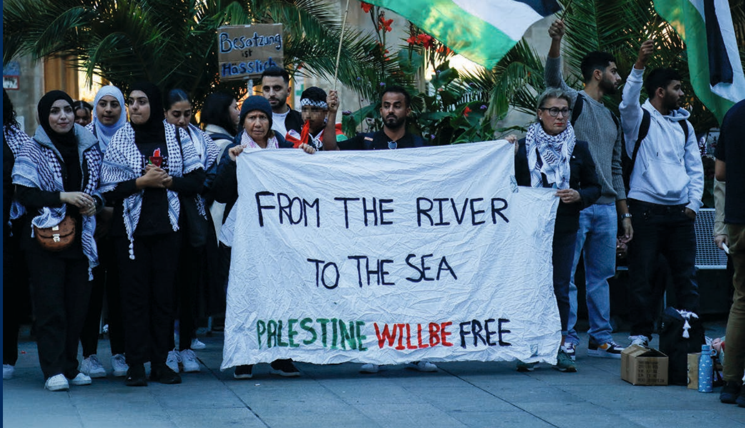
Demonstrierende fordern wenige Tage nach dem 7. Oktober 2023 auf dem Marienplatz mit einem Transparent die Auslöschung Israels.